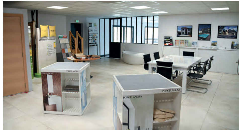
Le showroom Maisons RDV.

En choisissant des matériaux de qualité, nous apportons la touche qui valorise et harmonise la construction. Nous partons d'une feuille blanche, nous nous adaptons au terrain, à la réglementation